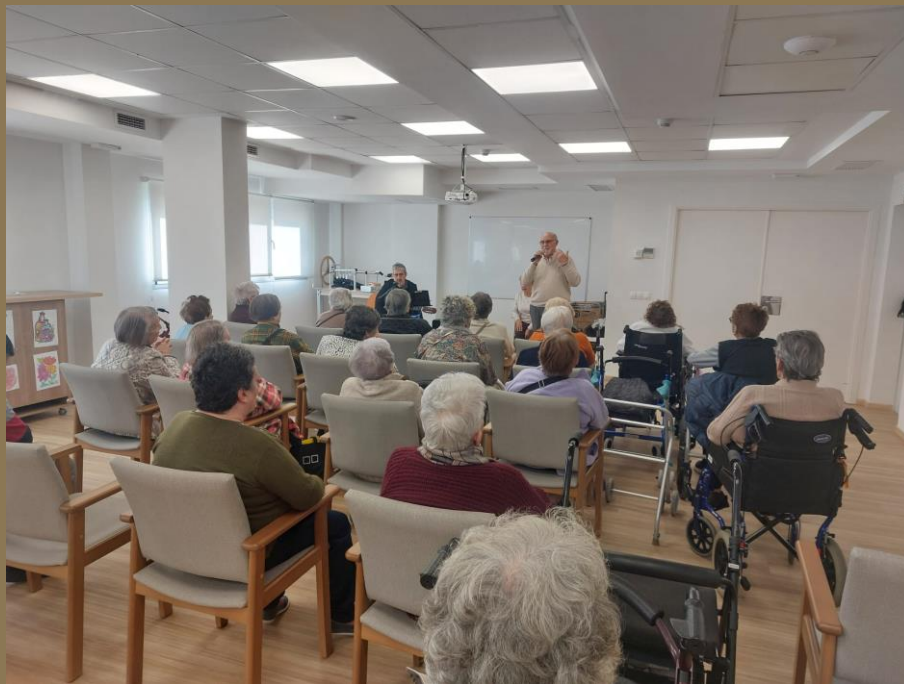
ACTUACIÓN LOS MAGNÍFICOS