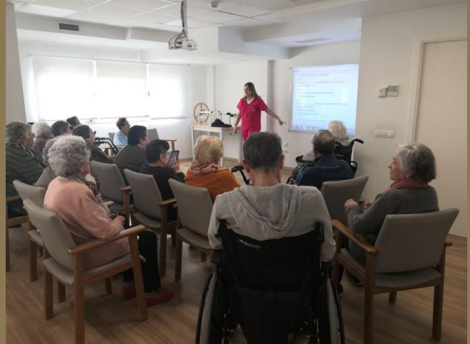
DÍA DE LA MÚSICA