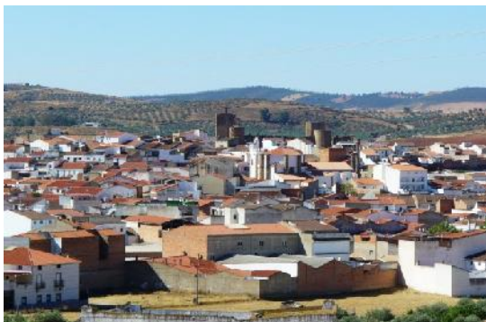
Zalamea de la Serena (Badajoz)

Esta vez, viajé con mi mujer y mis dos hijos mayores. Cuando ya nos instalamos en una casa y teníamos un empleo trajimos a mi hijo más pequeño.