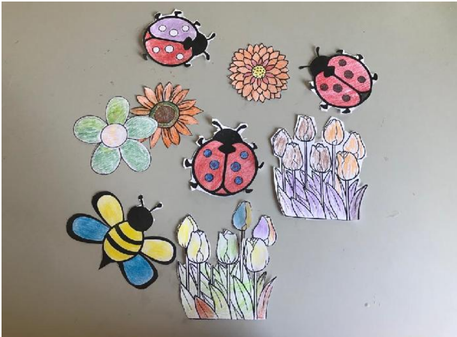
ELEMENTOS DECORATIVOS PARA CONFECCIONAR MURAL DE LA PRIMAVERA